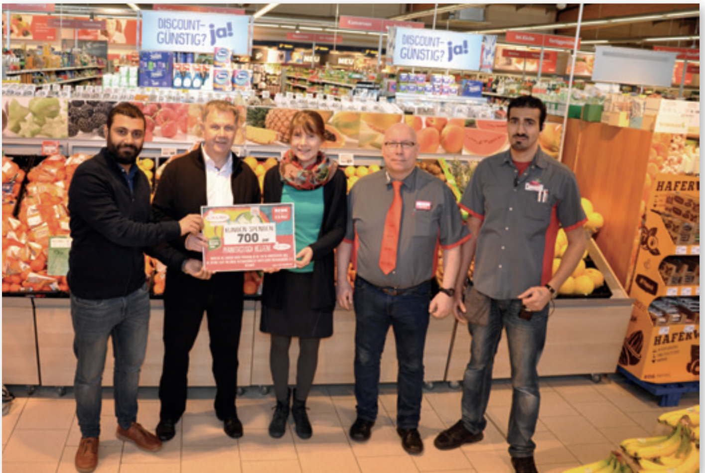
Auch der lokale Einzelhandel unterstützt durch Spenden das Modellprojekt Starke Nachbar*innen