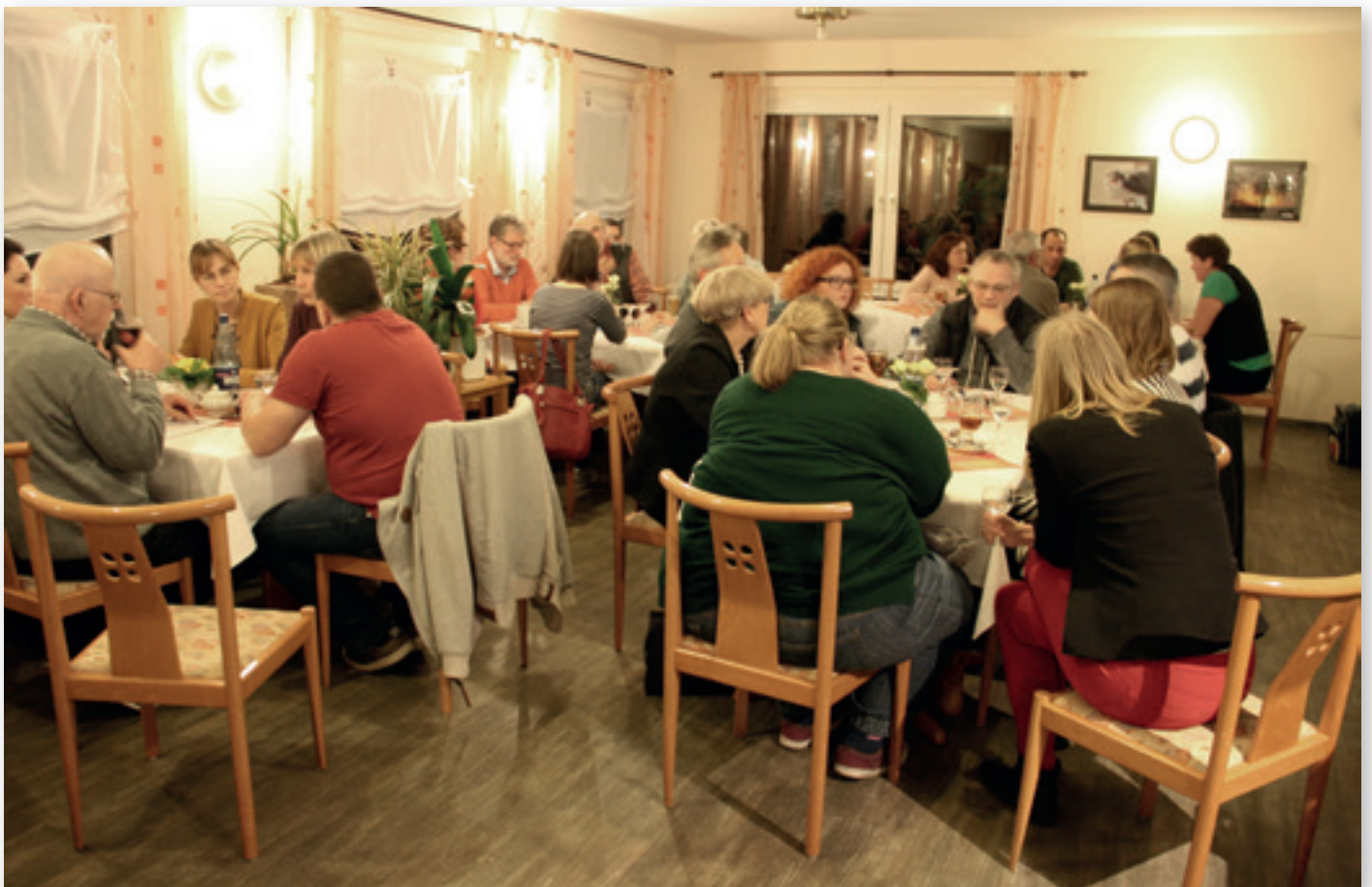
Zukunftsgespräche in Gardelegen

Das „Experiment Zukunftsgespräche“ fand großen Anklang: An vier Abenden im Frühjahr 2019 kamen insgesamt ca. 85 Teilnehmende. Seitens der Bürger*innen wurde der persönliche Kontakt zu Politik und Verwaltung als sehr positiv empfunden. Fragen zu Institutionen und Abläufen oder kon-