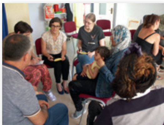
Nachbarschaftsgespräche in der Kita