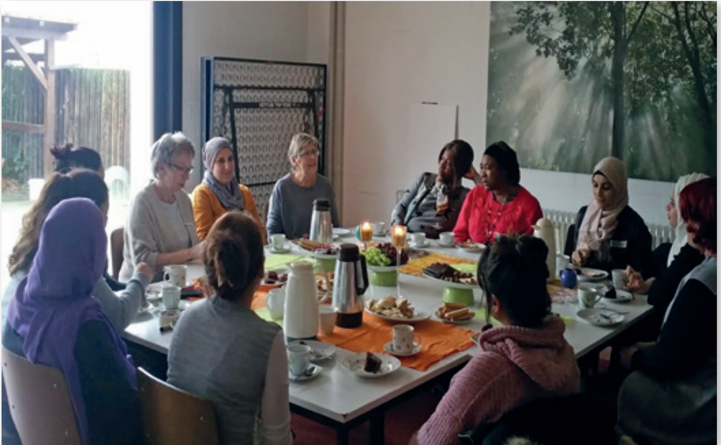
Das Projekt ist in vielen Nachbarschaften aktiv, hier bei der Frauengruppe in Flammersfeld im Kreis Altenkirchen