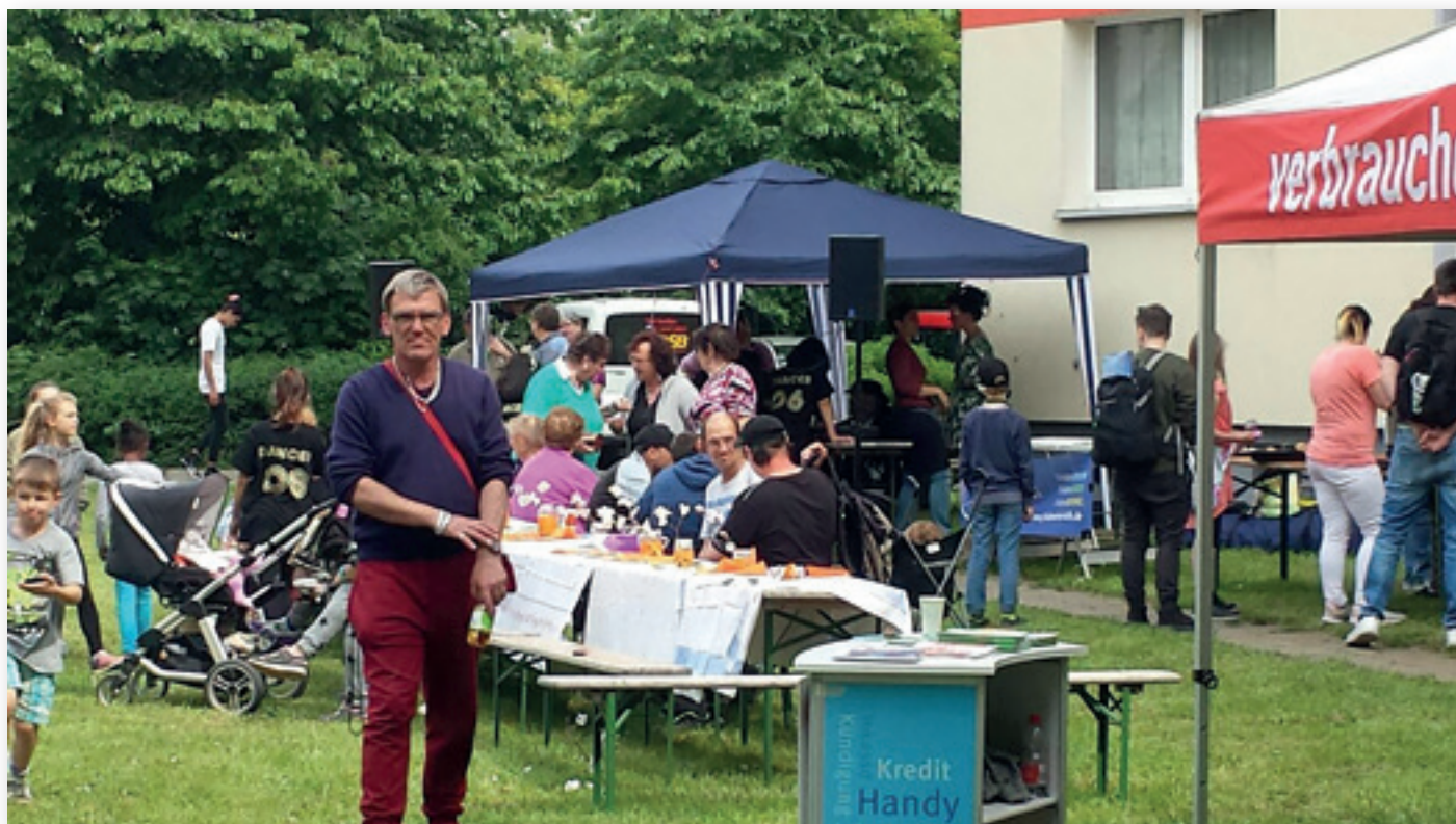
Tag der Nachbarn im Südpark

Wir lernten aus diesem ersten Versuch und verstanden im Austausch mit Kolleg*innen aus dem Stadtteil, dass wir bestehende Strukturen im Stadtteil noch enger einbinden mussten, und den Menschen an einem Ort die Begegnung ermöglichen, wo sie sich sicher fühlen. So entstand die Kooperation mit einer Kita im Stadtteil, die schon lange nach einer Möglichkeit gesucht hatte, Eltern in Kontakt zu bringen. Unter dem Slogan „Eltern treffen Eltern – Nachbarschaftsgespräche in der Kita Peter Pan“ luden wir Eltern mit mehrsprachigen Flyern zu einem Begegnungsnachmittag ein. Gleichzeitig organisierten wir Sprachmittler*innen für Französisch, Arabisch und Somali. Die Eltern folgten dieser Einladung und kamen zum ersten Mal mit anderen Eltern ins Gespräch, denen sie zwar täglich in der Kita begegnen, mit denen sie sich aber noch nie unterhalten hatten. Weitere Nachbarschaftsgespräche in der Kita folgten.