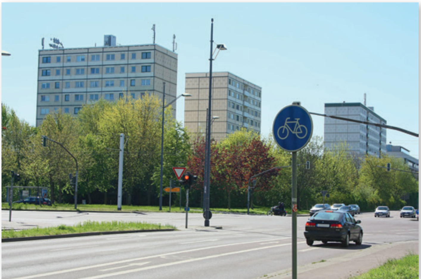
Halle-Neustadt, Kreuzung Magistrale-Feuerwache.

Die anfängliche Analyse zeigte, dass für viele die eigene Familie der Referenzrahmen ist. Von Rassismen geprägte Erzählungen über zugezogene Gruppen gibt es viele, Bekanntschaften mit Menschen anderer Nationalitäten sind jedoch selten. Der Rückzug ins Private verstärkt Sprachunfähigkeit und Unsicherheit, wie mit unterschiedlichen Lebensweisen und Konflikten im Zusammenleben umgegangen werden kann. Es gibt keine Übung mit Meinungsverschiedenheiten umzugehen und Differenz auszuhalten. Die negative Berichterstattung durch Medien verstärkt Stigmatisierungen im Stadtteil. Eine weitere zentrale Erkenntnis war, dass es vor Ort viele engagierte Träger und Einzelpersonen gibt,